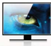
Display 7" ad alta risoluzione

Semplice da installare iShelf 2 grazie al pratico kit di montaggio è alimentato da comuni batterie.