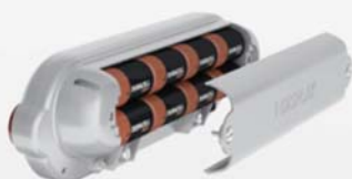
Alimentazione a batterie