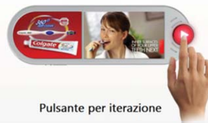
Pulsante per iterazione